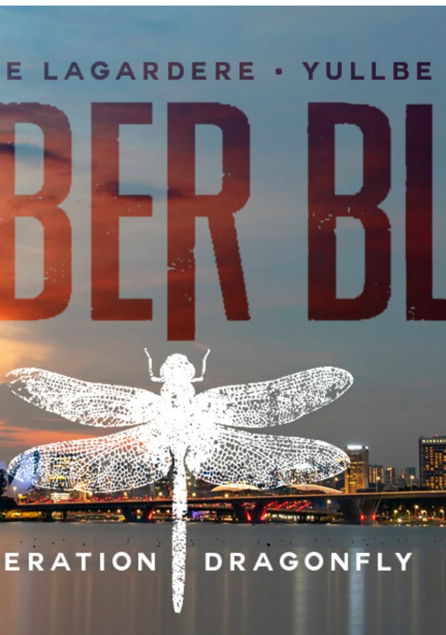
Das interaktive Action-Abenteuer Amber Blake: Operation Dragonfly erobert im Frühjahr 2022 die virtuelle Welt