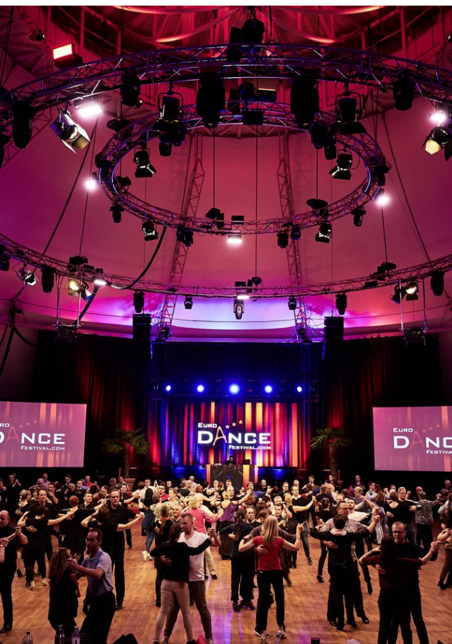
Beim Euro Dance Festival im Europa-Park Erlebnis-Resort werden über 370 Workshops in den unterschiedlichsten Tanzstilen angeboten