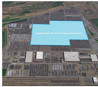
Gelände MOSOLF Group Kippenheim mit eingezeichneter Fläche für die Photovoltaikanlage