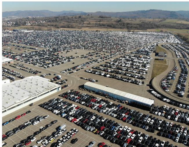
Gelände MOSOLF Group Kippenheim