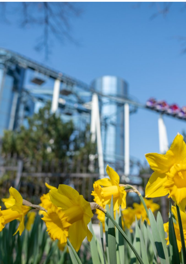
Am 25. März startet der Europa-Park in die Sommersaison.