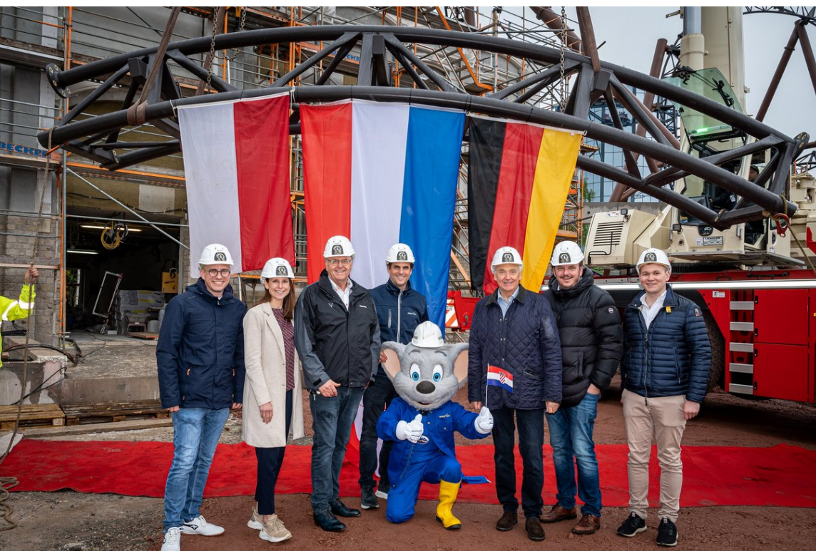
Meilenstein Schienenschluss: Am 16. Mai feiert die Inhaberfamilie Mack mit geladenen Gästen und dem Bürgermeister der Gemeinde Rust Kai-Achim Klare (l.) den Einbau des letzten Schienenelements mit der Nr. 80.