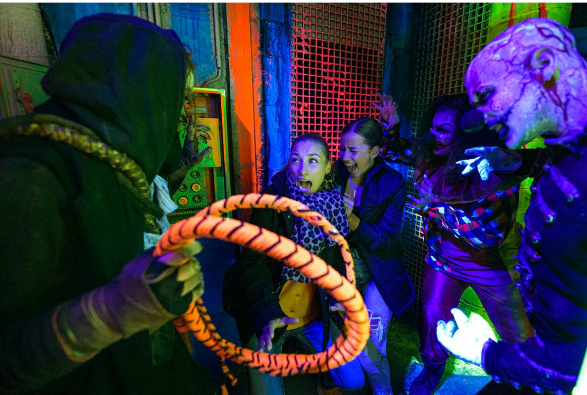
Düstere Kreaturen sorgen bei Traumatica – Festival of Fear für Alpträume