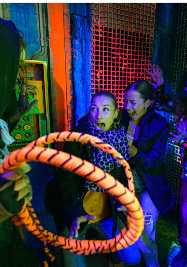
Düstere Kreaturen sorgen bei Traumatica - Festival of Fear für Alpträume

Der Zutritt ist ab 16 Jahren gestattet. Besucher/innen unter 16 Jahren, auch in Begleitung eines Erziehungsberechtigten, haben keinen Zutritt zum Event. Einlass ist ab 18.45 Uhr, Beginn um 19.00 Uhr.