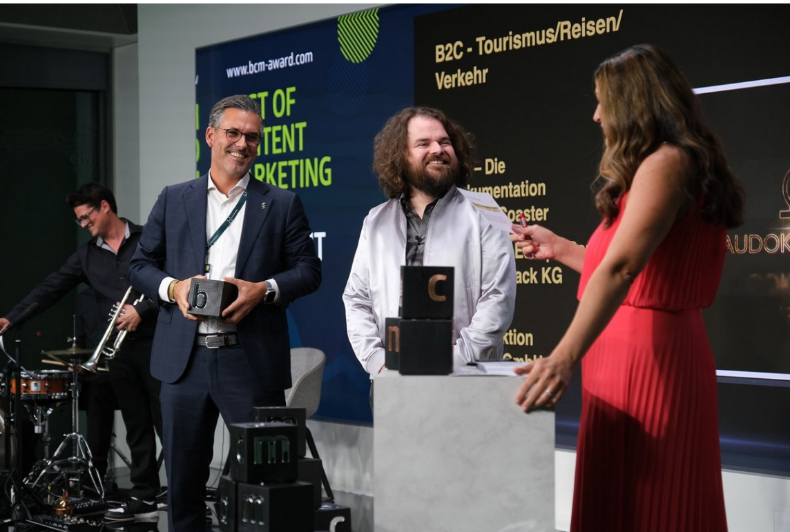
Die VEEJOY-Serie „Ω – Die Baudokumentation“ wurde mit Gold beim Best of Content Marketing Award ausgezeichnet