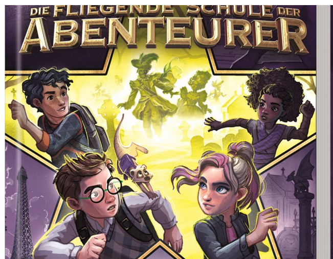
Der sechste Band der beliebten Romanreihe: „Die fliegende Schule der Abenteurer – Die Geister des Verbotenen Tals“