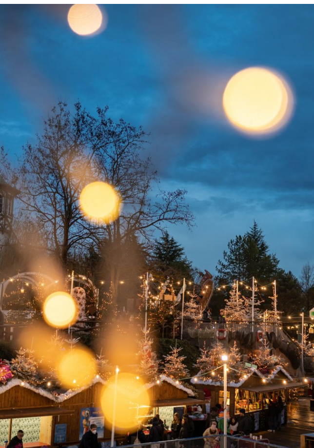
Der Europa-Park verwandelt sich in ein Winterwunderland