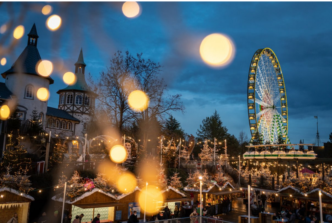
Der Europa-Park verwandelt sich in ein Winterwunderland