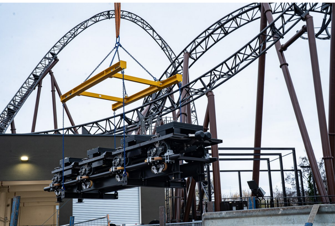
Der erste von sieben Zügen ist angekommen