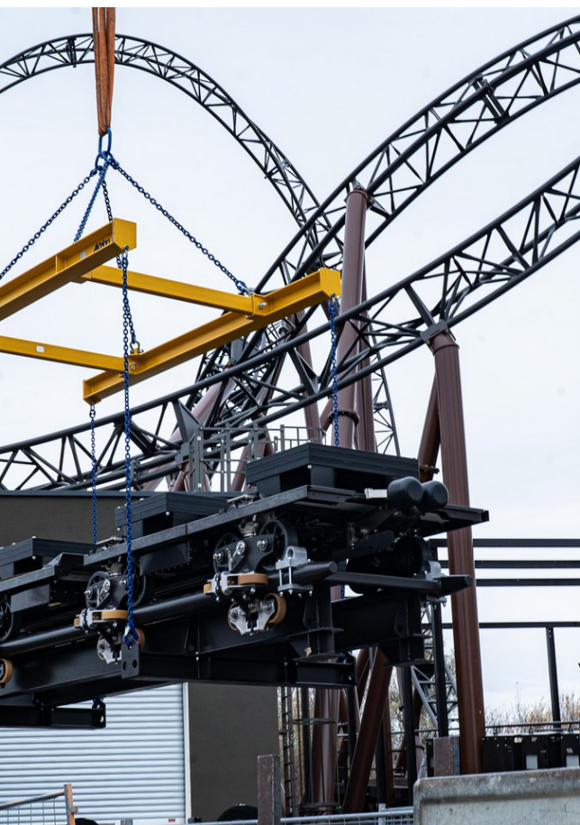
Der erste von sieben Zügen ist angekommen