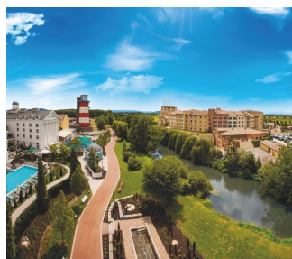
Die Europa-Park Hotels bilden zusammen das größte zusammenhängende Hotel-Resort Deutschlands