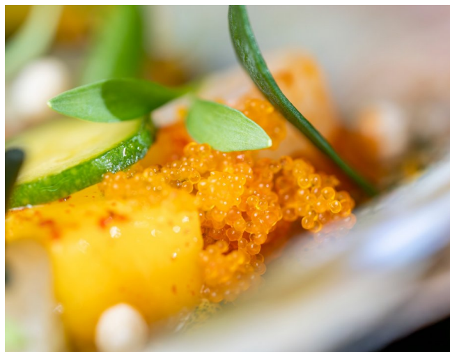
Sinnliches aus den Tiefen des Meeres