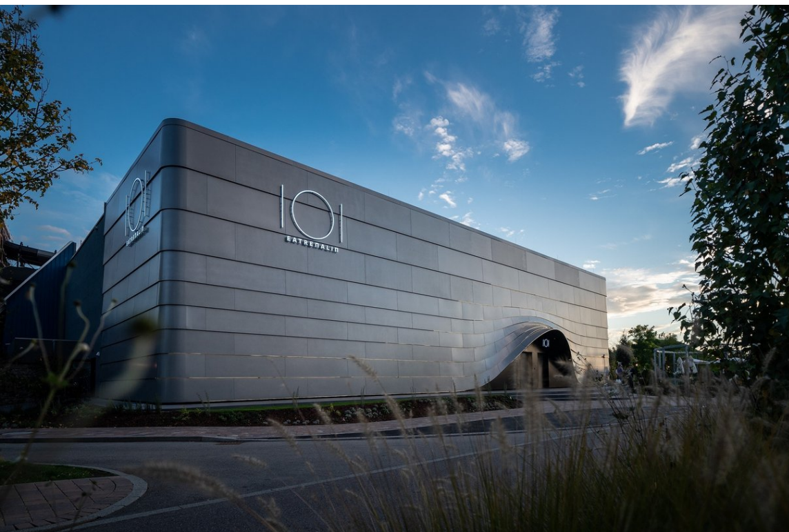
Eatrenalin begeistert die Gäste seit zwei Jahren