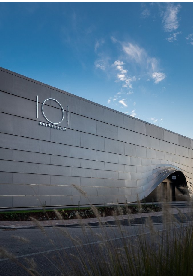
Eatrenalin begeistert die Gäste seit zwei Jahren

Bewertungen, die weltweit über einen Zeitraum von 12 Monaten auf Tripadvisor abgegeben wurden. Mit Travellers' Choice Awards werden Unternehmen gewürdigt, die durchgehend großartige Bewertungen erhalten. Die Gewinner dieser Auszeichnung gehören zu den besten 10 % der auf Tripadvisor eingetragenen Unternehmen. Ausgewählte Unterkünfte, Sehenswürdigkeiten und Restaurants, die dauerhaft eine erstklassige Gastfreundschaft zeigen, erhalten einen Travellers' Choice Award von Tripadvisor.