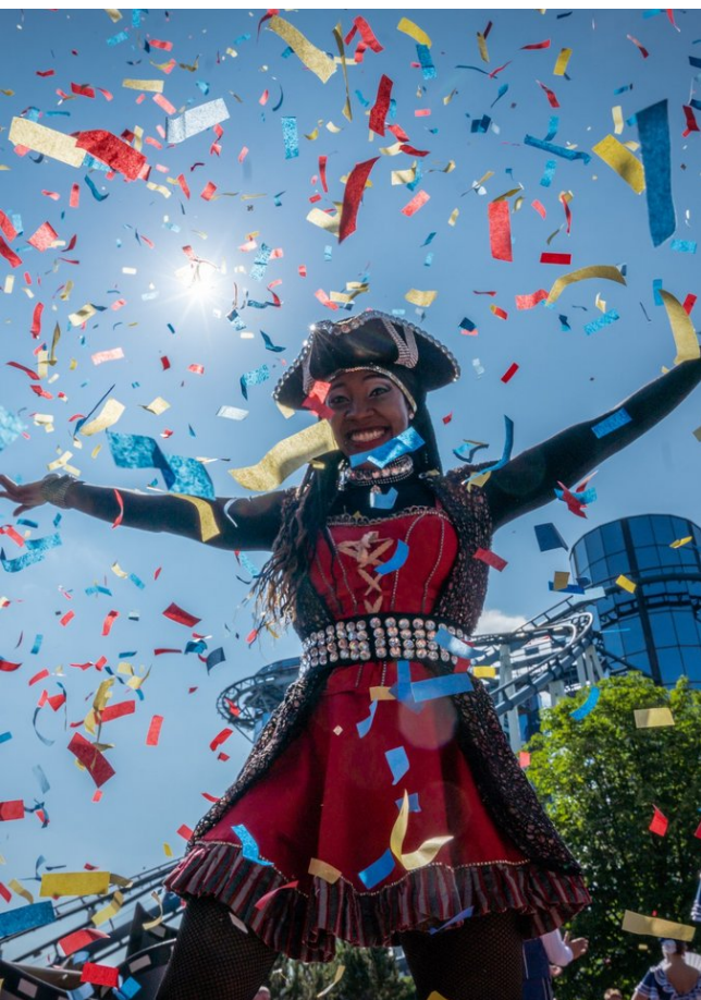
Der Europa-Park feiert 2025 seinen 50. Geburtstag