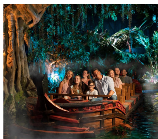
"Piraten in Batavia" im holländischen Themenbereich strahlt seit 5 Jahren im neuen Glanz