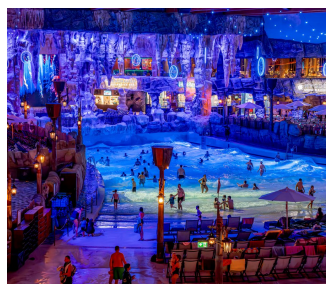
Das Wellenbecken Surf Fjord verwandelt sich am Abend in eine Bühne für spektakuläre Lichtinstallationen, atemberaubende Effekte und Luftakrobatik hoch über dem Wasser