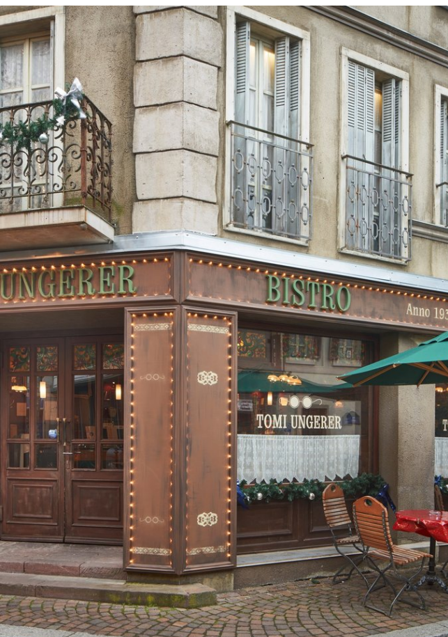
Le « Bistro Tomi Ungerer » dans le quartier français