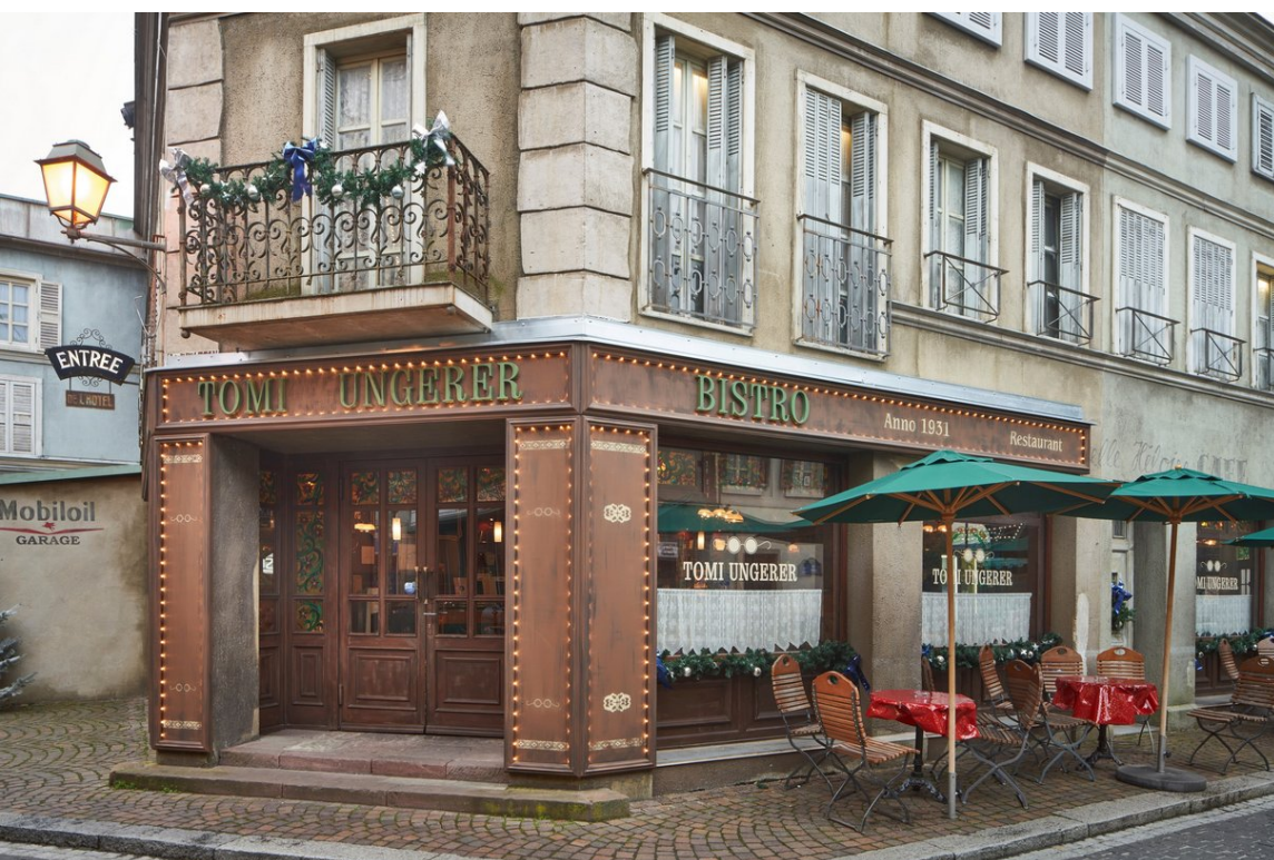
Le « Bistro Tomi Ungerer » dans le quartier français

Hommage à un ambassadeur de l'amitié franco-allemande