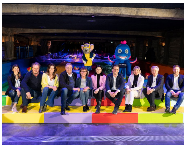
La famille Mack lors de l'inauguration de « Vikingløp ».