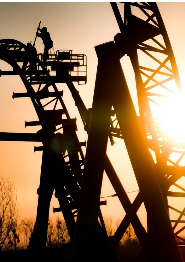
Plus de 700 ouvriers travaillent sur les chantiers d'Europa-Park Resort