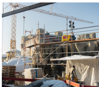
« Express des Alpes Enzian » et « Les Rapides du Tyrol » reviennent dans le quartier autrichien d'Europa-Park