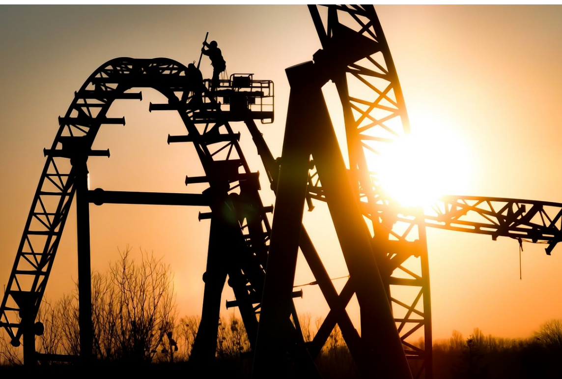
Plus de 700 ouvriers travaillent sur les chantiers d'Europa-Park Resort