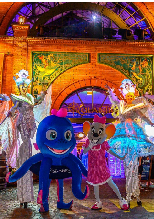
Rulantica sera ouvert à trois reprises jusqu'à minuit

L'événement estival avec ses nombreuses animations spéciales, de la musique live et une multitude d'attractions, est compris dans le billet d'entrée daté journée, soirée et Moonlight Rulantica.