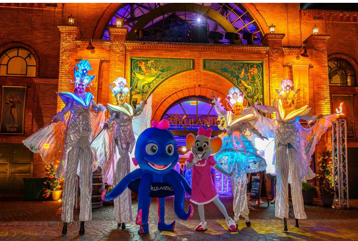
Rulantica sera ouvert à trois reprises jusqu'à minuit

Plus de 14 heures de plaisirs aquatiques