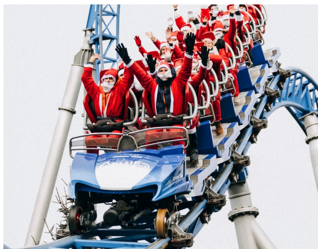
Les Pères-Noël ont pu découvrir le grand huit « blue fire Megacoaster »