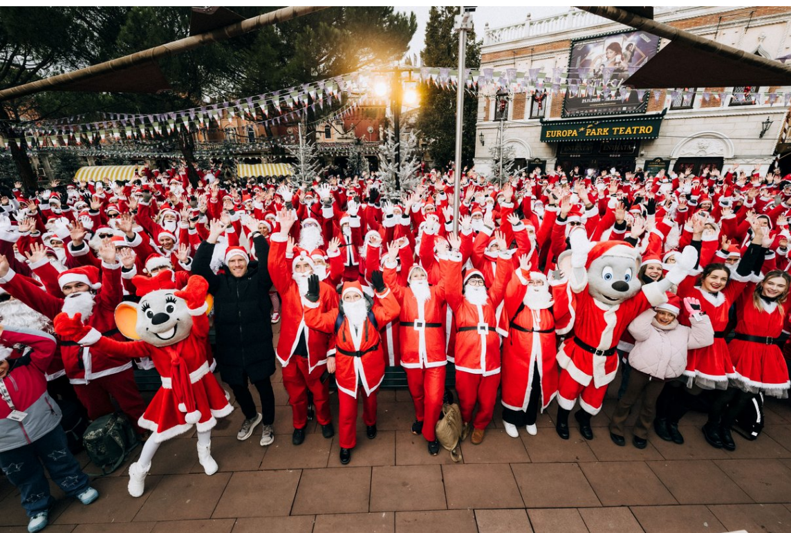
Grand rassemblement des Pères-Noël à Europa-Park