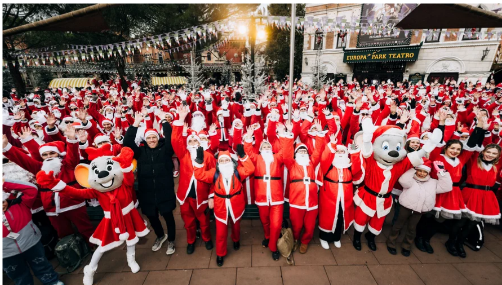
Grand rassemblement des Pères-Noël à Europa-Park