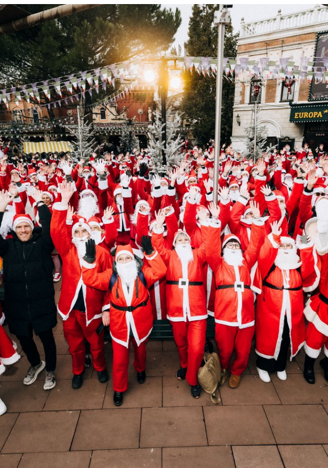
Grand rassemblement des Pères-Noël à Europa-Park