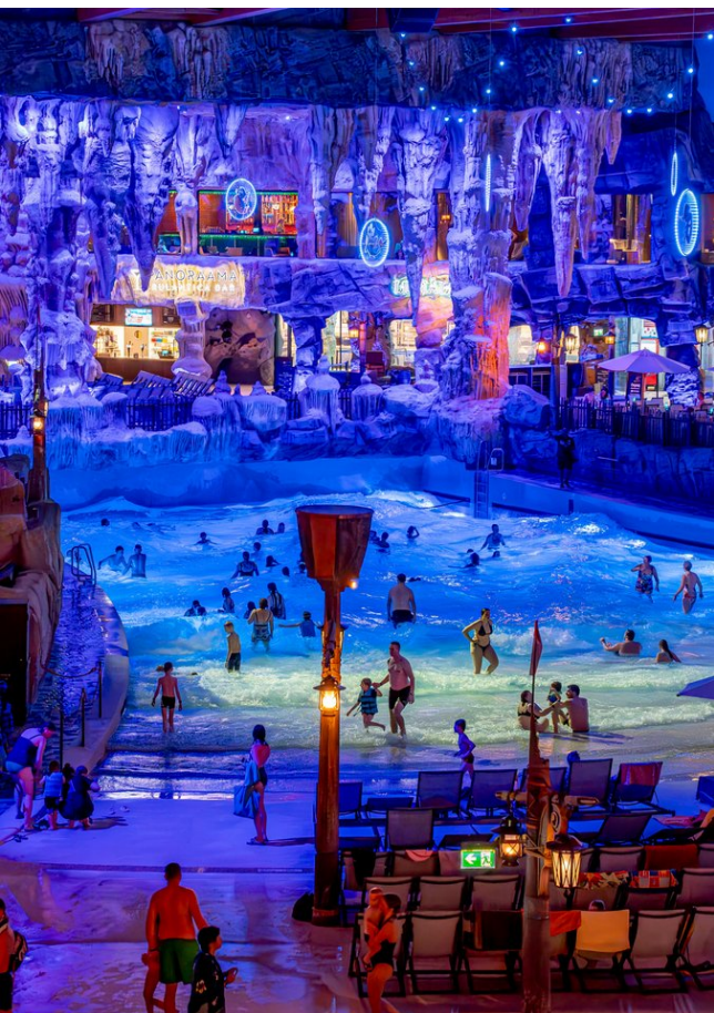
Le samedi 7 février, l'univers aquatique d'Europa-Park ouvre ses portes jusqu'à minuit