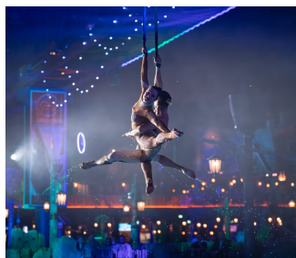
Pour le plus grand plaisir des visiteurs, le show « NORDLYS – Polar Illumination » se tient trois fois ce jour-là