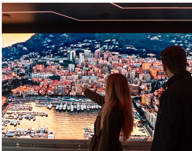
Visiteurs découvrant la Principauté monégasque dans toute sa diversité : des monuments emblématiques et ses ports de plaisance.