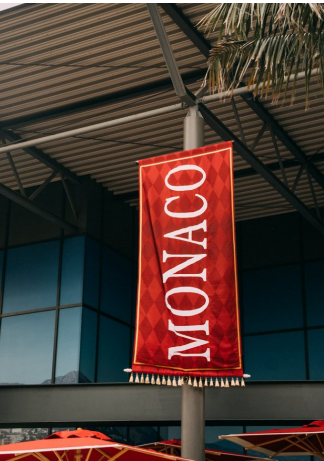
Monaco, le 18 e quartier thématique européen d'Europa-Park.