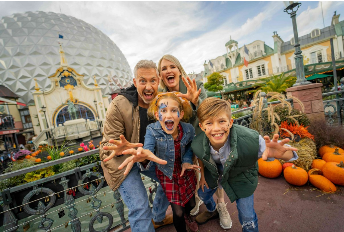
[Translate to French:] Une famille célébrant Halloween à Europa-Park